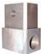
SUPPORTO FILETTATO IN GHISA DX R591013 SX R5910131