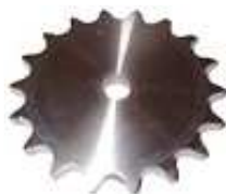
CORONA 5/16" Z18 R59144