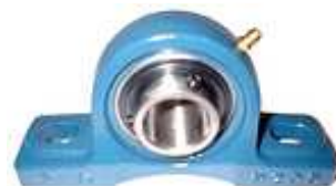
SUPPORTO A CUSCINETTO UCP205 R59130